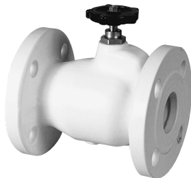
ナイロンコーティング製