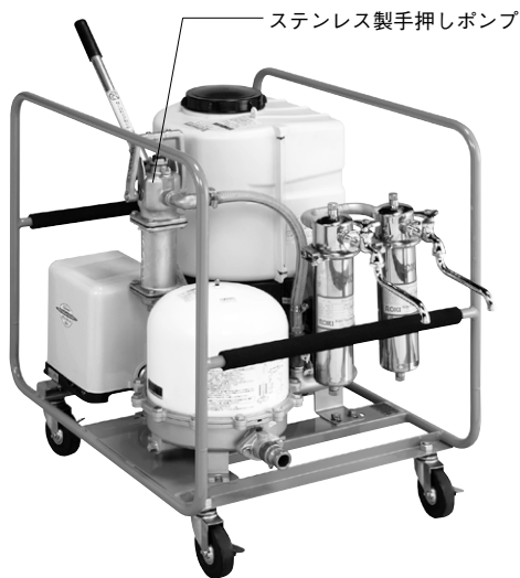
ステンレス製手押しポンプ